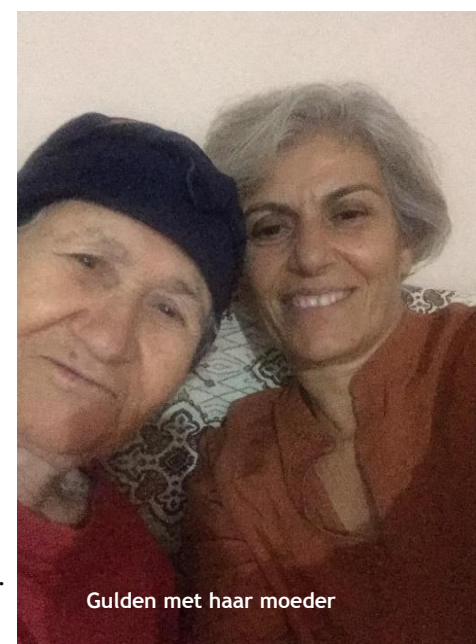
Gulden met haar moeder