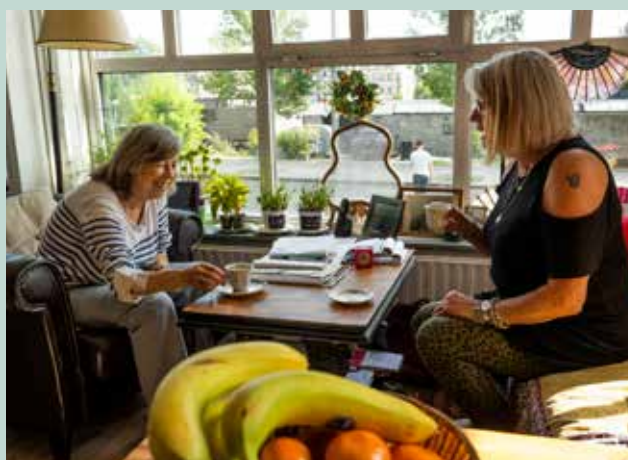
Een buurtbewoner en vrijwilliger van VEIZ samen aan de koffie.

Een manier om klein te beginnen is om eens te kijken op platform BUUV Amsterdam Zuid ( amsterdamzuid.buuv.nl ). Op dit platform kunnen buurtbewoners zelfstandig op zoek naar vrijwilligerswerk in de buurt of ze kunnen zelf hulpvragen online plaatsen. Daarnaast kun je je ook via organisaties aanmelden voor vrijwilligerswerk of