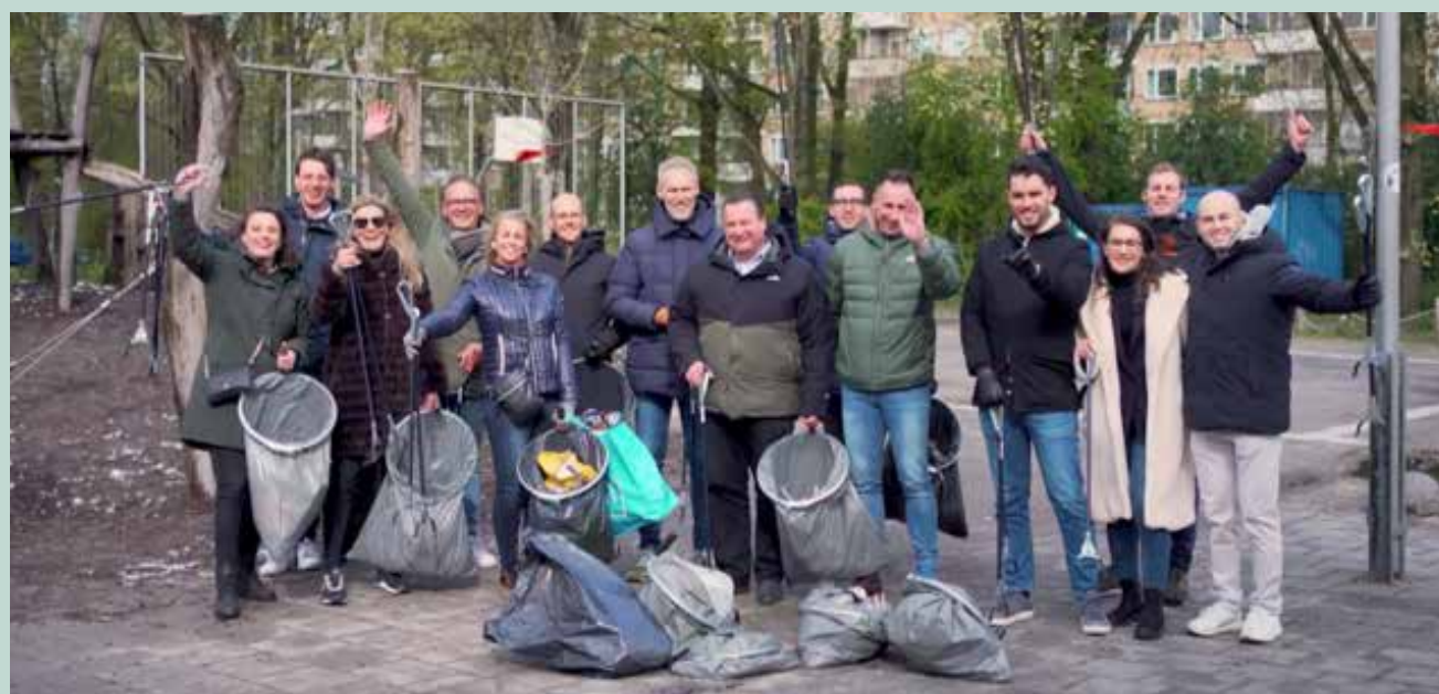
Medewerkers van ING doen vrijwilligerswerk in Buitenveldert