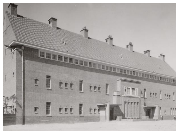
Links Talmud Toraschool; rechts Joodse school 9

Sinds 1935 zat de Talmud Toraschool B in het schoolgebouw, gelegen in de meest Joodse buurt van Amsterdam. Aangezien er al een Talmud Toraschool bestond in de Tweede Boerhaevestraat, kreeg de school in de Kraaipanstraat de toevoeging 'B' om onderscheid te maken. Naast reguliere vakken werden religieuze vakken en Hebreeuws onderwezen. Ook werden de Joodse feestdagen gevierd. Na de grote razzia's, onaangekondigde klopjachten waarbij in korte tijd groepen mensen werden opgepakt, in juni 1943 werd de school gesloten. Alle leerlingen en leerkrachten waren verdwenen. De meesten werden gedood in concentratiekampen in het Oosten.